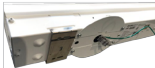
Unique J-Box cover supplied