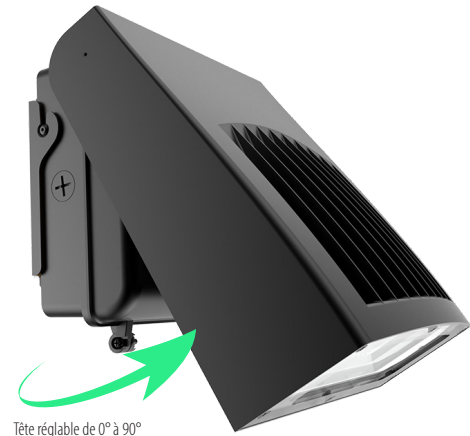
Tête réglable de 0° à 90°